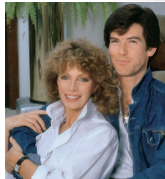
TRAGISCHES ENDE Cassandra Harris war Pierce Brosnans erste Ehefrau. Die Schauspielerin starb 1991 an Krebs