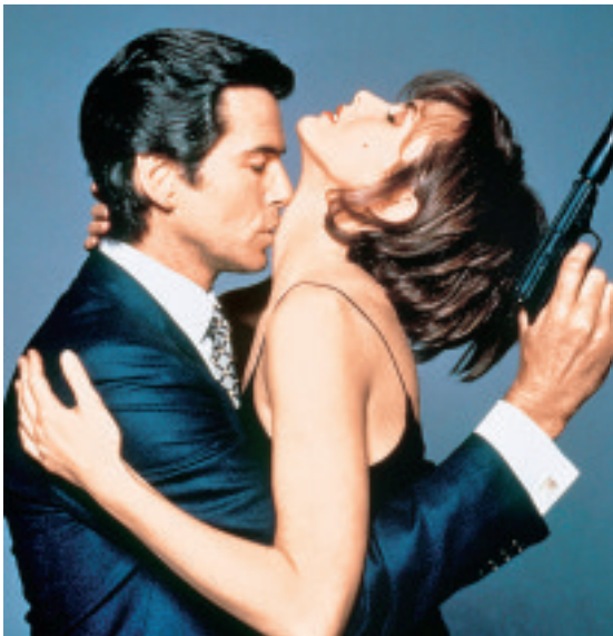
KÜHLE LEIDENSCHAFT Als James Bond küsste er die Frauen. Aber so wie die Lieben seines Lebens beehrte er keine